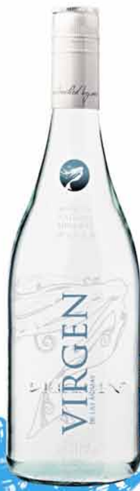
圣女天然矿泉水 Virgen | 乌拉圭

艾特丝矿泉水的水源来自一口位于意大利利古里亚区卡利扎诺市的古井，临近西方文明的摇篮地，是古代泉水的现代时尚演绎。早在古意大利时期，伊特拉斯坎人就因娴熟的酿酒工艺而盛名远播，对之后的罗马文化产生了显著的影响。艾特丝水从意大利索维尔泽内镇的一处泉眼中源源不断地涌出来，泉源的海拔高度为1100米，位于一片纯净无污染的森林保护区之中。水源地所在的村庄风景优美，坐落于著名的阿尔卑斯山脉和亚平宁山脉交界地带。