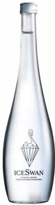
冰天鹅冰川水 Ice Swan | 智利

爱瑞来自瑞典的一个偏远地区。其充满时尚感的玻璃瓶，是奢华餐桌上的一个亮点。爱瑞矿泉水的水源地在艾瑞斯库坦山脉脚下的艾瑞达伦地区，一个坐落于瑞典北部的滑雪胜地。艾瑞斯库坦山脉由有着数千年历史的冰原构成，连绵的山脊对水起着过滤作用。古老的地下水资源受到大自然的有力保护，免受环境污染和其他危害。是瑞典国内为数不多的得到官方认证的天然矿泉水。其品牌诞生于2011年，由三位热爱水的瑞典籍企业家共同创立。