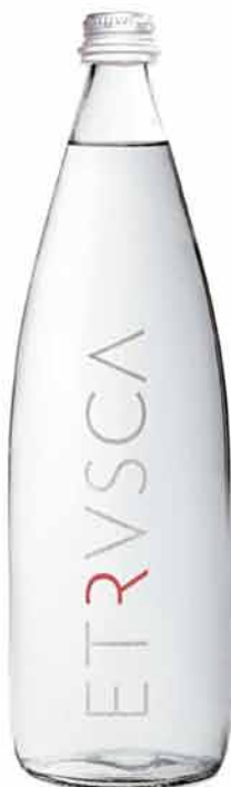
艾特丝矿泉水 Etrvsca | 意大利

冰天鹅是一款软性的轻度发泡冰川水，水龄为4万到5万年。其典雅的玻璃瓶身由著名设计师塞巴斯蒂安·埃拉苏里兹设计，呈现高档品质。冰天鹅的水源为冰川水流，地处智利巴塔哥尼亚的昆拉特国家公园内，最早由一位耶稣会牧师于1767年发现。之后人们在此地建立了覆盖面积为15.4万公顷的国家公园，很好地保护着包括原始森林、海峽、冰川以及冰原在内的自然地理环境。冰天鹅冰川水直接在水源地装瓶，现代化的工厂却有着极为环保的设计。