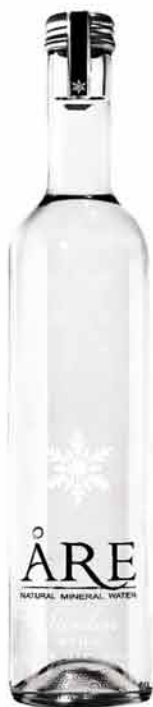
爱瑞矿泉水 Are | 瑞典

地区：耶姆特兰省 水源地：艾瑞达伦镇 创立：2011年 水源：泉源 碳酸化：人工碳酸化 纯净度：很纯净 矿物质含量：低 硬度：中等 酸碱度：碱性